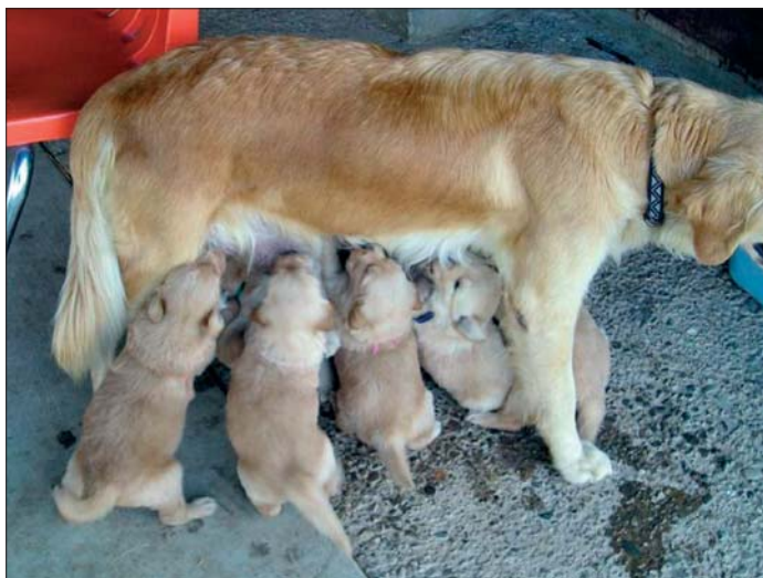
Ein Wurf und die anschließende Aufzucht bedeuten für eine Zuchthündin eine enorme körperliche und psychische Belastung,