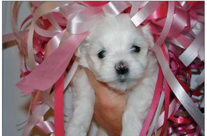
Massenzüchter erkennt man daran, dass sie mehrere Hunderassen vermehren. Häufig sind dies „gut gehende“ Kleinhunderassen wie z. B. Malteser.

Die bewiesenen Golden Retriever-Würfe würden darüber hinaus auch Kirchbergers Aussage widerlegen, dass sie „nur Kleinhunde“ züchte, heißt es in Tierschutzkreisen. Originalzitat aus einem WUFF vorliegenden Kaufvertrag Kirchbergers: „Ich habe mehrere Golden Retriever Hündinnen, daher kann es öfter Junge geben ...“. Kritiker der