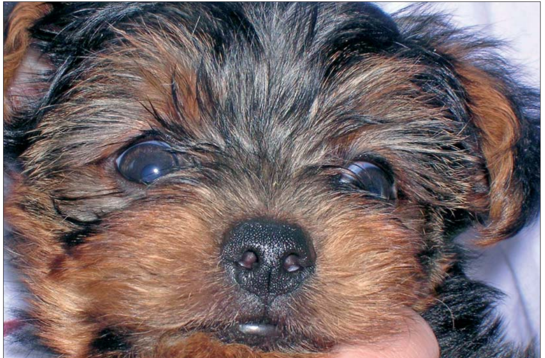
Kleinhunde haben üblicherweise eine höhere Vermittlungschance als größere Hunde, dennoch sind die Tierheime derzeit mit Hunden so voll wie nie!