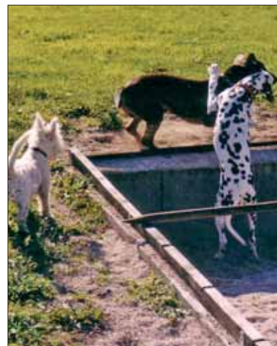
Zwischen den Übungen in der Hundeschule ist Spielen angesagt.