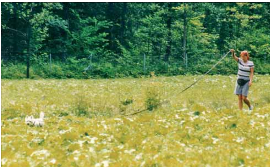
Auf der Fährte zeigt Jeanny große Freude und Sicherheit.